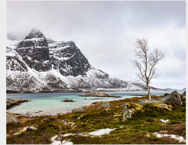
Henryk Bies - Moorbirke, Grotfjorden