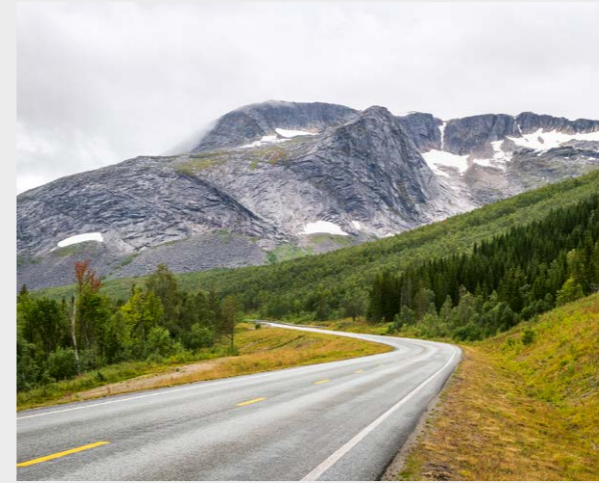
Henryk Bies - Fernstraße, Nordland