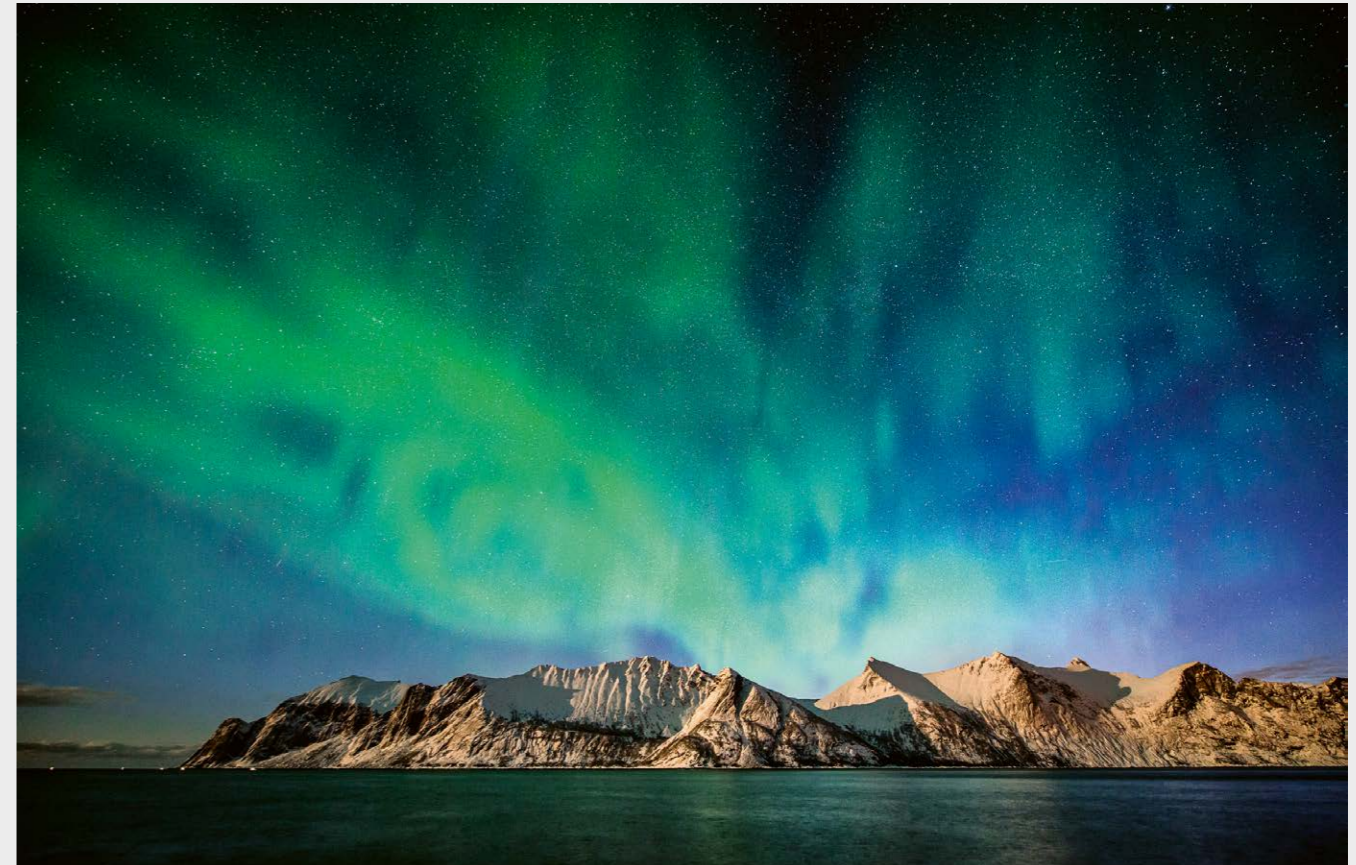
Henryk Bies - Monduntergang, Mefjorden

Sie findet am Dienstag, 7. Februar 2023, 17 Uhr, im Klinischen Arztendienst des Diakonissenkrankenhauses Leipzig statt.