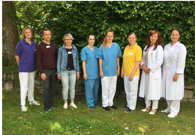
Der Palliativmedizinische Konsiliardienst des Diakonissenkrankenhauses Leipzig ist fachübergreifend zusammengesetzt.

Der Palliativmedizinische Konsiliardienst wird im Diakonissenkrankenhaus Leipzig bei Bedarf und auf Anfrage (durch den zuständigen Stationsarzt) tätig. Er betreut Patienten und ihre Angehörigen in enger Zusammenarbeit mit dem jeweiligen Behandlungsteam.