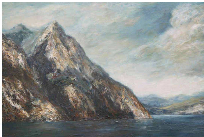
Westufer des Gardasees

Wir freuen uns über Ihr Interesse und auf Ihr Kommen!