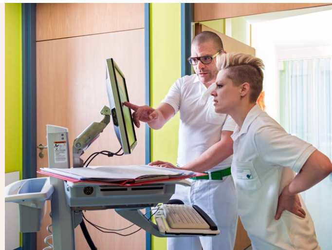
Eine umfassende Diagnostik ist die Grundlage für eine zielgenaue Therapie bei Fuß- und Sprunggelenkerkrankungen.