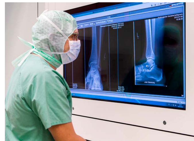
Volle Konzentration: im Operationssaal während einer Fuß-OP.

Die Überprüfung und Zertifizierung unseres Behandlungszentrums erfolgte Ende September 2016 durch unabhängige Gutachter des Zertifizierungsinstitutes ClarCert. Im Rahmen des Audits wurde die Patientenversorgung im Bereich der Fuß- und Sprunggelenkerkrankungen in ihrer Gesamtheit detailliert beleuchtet und zu bewertet – von den Behandlungspfaden über die Qualität und Quantität der Eingriffe bis hin zur persönlichen Qualifikation der Operateure und der interdisziplinären Zusammenarbeit mit anderen Fachgebieten. Ergebnis: das neue Fuß- und Sprunggelenkszentrum am Ev. Diakonissenkrankenhaus Leipzig erfüllt hinsichtlich Diagnostik und Therapie in allen Punkten die hohen Anforderungen des Fachverbandes D.A.F., der als Sektion der Deutschen Gesellschaft für Orthopädie und Unfallchirurgie angehört.