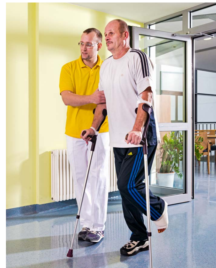
Physiotherapeutische Maßnahmen sind fester Bestandteil im Behandlungskonzept des Fuß- und Sprunggelenkzentrums.